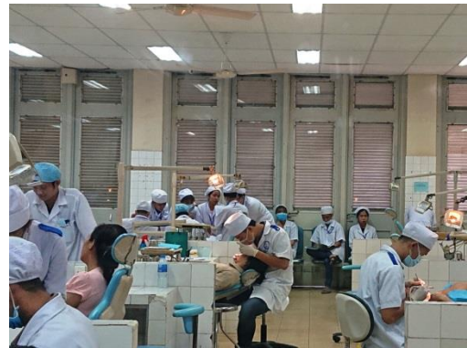
先進的な歯科医療の教育環境を学生たちに提供しているホーチミン医科薬科大学