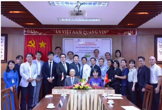
教育協定の調印式には学校関係者のほか、ベトナム国内の歯科医療機関、企業3社の代表が出席した。

ベトナム歯科技工分野の専門人材育成を目的とした国際的な産学連携による教育提携について(PDF)